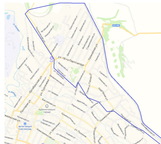
СХЕМА ГРАНИЦ ТОС Горка г. Светлограда Петровского городского округа Ставропольского края