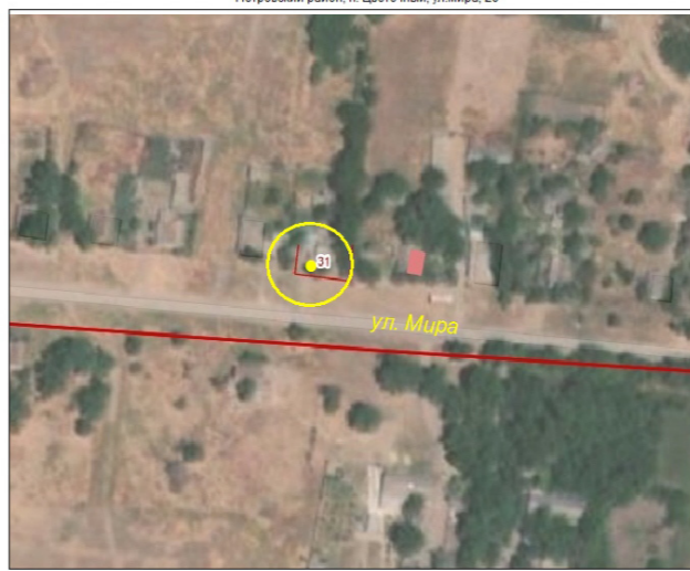
Схема границ территорий, прилегающих к Фельдшерско-акушерскому пункту государственного бюджетного учреждения здравоохранения Ставропольского края «Петровская районная больница» расположенному по адресу: Ставропольский край, Петровский район, п. Цветочный, ул. Мира, 20

Приложение 115 к постановлению администрации Петровского городского округа Ставропольского края от 07 февраля 2022 г. № 131