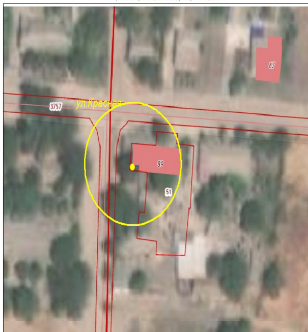
Схема границ территорий, прилегающих к Фельдшерско-акушерскому пункту государственного бюджетного учреждения здравоохранения Ставропольского края «Петровская районная больница» расположенному по адресу: Ставропольский край, Петровский район, п. Мзак, ул. Красная, 41

Приложение 114 к постановлению администрации Петровского городского округа Ставропольского края от 07 февраля 2022 г. № 131