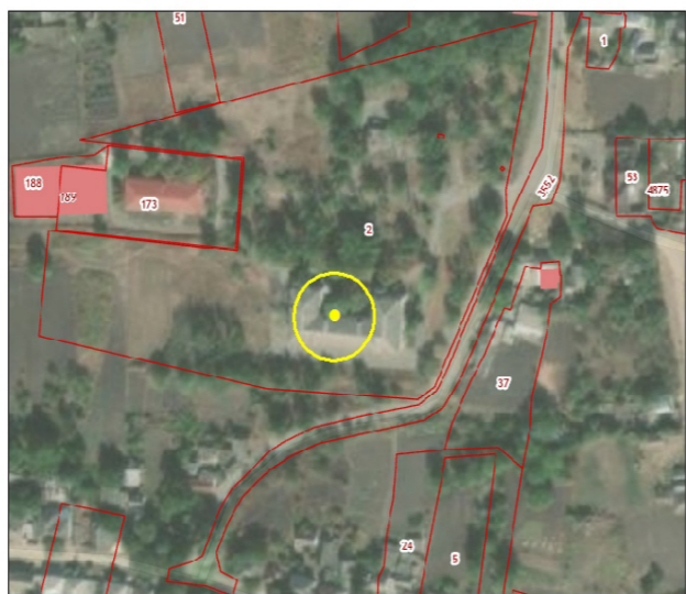
Схема границ территорий, прилегающих к Сухобуйволинской участковой больнице государственного бюджетного учреждения здравоохранения Ставропольского края «Петровская районная больница» расположенной по адресу: Ставропольский край, Петровский район, с. Сухая Буйвола, ул. Кузнечная, 1

Приложение 116 к постановлению администрации Петровского городского округа Ставропольского края от 07 февраля 2022 г. № 131